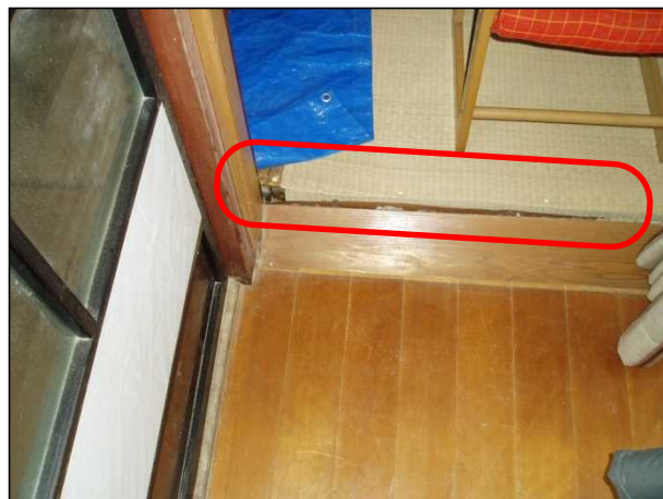
床と壁との間にわずかなずれが生じている。