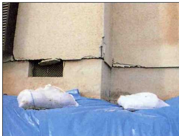
床板にずれ、若干の不陸が見られる。